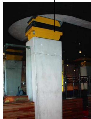
Wibroizolatory w przebieralni