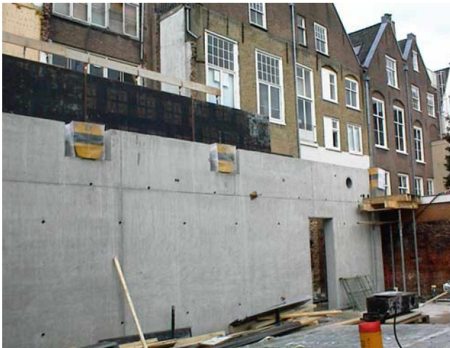
Wibroizolacja sali tanecznej